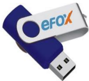
USB flash drive